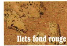
Ilets fond rouge